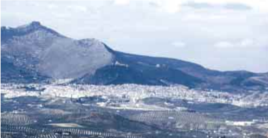
Jaén será sede de estas primeras Jornadas de Planificación Estratégica en Andalucía.

El 29 y 30 de octubre próximos se celebrarán en Jaén las I Jornadas sobre Planificación Estratégica en Andalucía. Con ello se pretende intercambiar experiencias y reforzar líneas de cooperación entre organismos y fundaciones con responsabilidades en planes similares para alcanzar un mayor éxito en cada ámbito territorial y, por tanto, una mayor proyección general en nuestra Comunidad Autónoma.