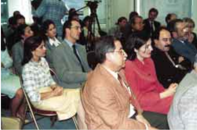
Vista parcial de los técnicos, consultores y altos cargos comunitarios asistentes a la presentación del Plan Estratégico de la provincia de Jaén en Bruselas, en la sede de la Delegación de la Junta de Andalucía en aquella ciudad.