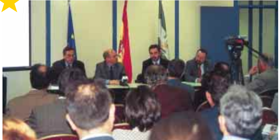
Imagen parcial de los asistentes al acto de Bruselas.

El día 21 de junio la Fundación "Estrategias" culminó su fase de presentaciones del Plan Estratégico de la provincia de Jaén en un acto organizado con la colaboración inestimable de la Delegación de la Junta de Andalucía en Bruselas ante un amplio grupo de responsables y técnicos comunitarios interesados por comprobar las sinergias y la voluntad de acción de un territorio comprometido activamente con su futuro.