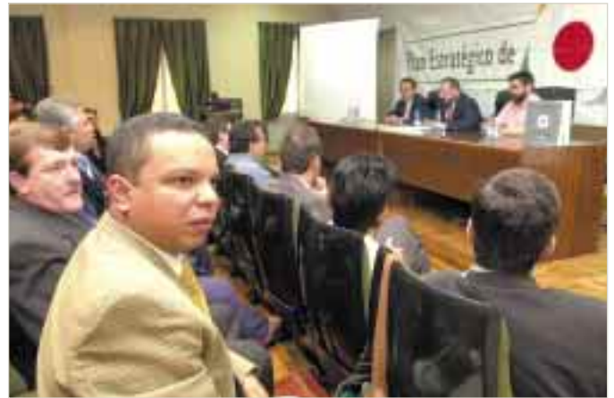
Jornada monográfica sobre el Plan Estratégico de la provincia en la Escuela de Verano de la Unión Iberoamericana de Municipalistas celebrada en Jaén, durante el mes de septiembre.