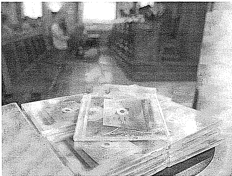
EN DISCO COMPACTO. Los contenidos del plan estratégico de la provincia, digitalizados.

En el mes de marzo, y una vez pasado un periodo de reflexión y de análisis de lo que ha sido el plan, se espera contar con un análisis claro de cada proyecto pasado y con una nueva serie de propuestas que seguirán siendo «la hoja de ruta» del Gobierno. «El Plan Estratégico no ha sido la