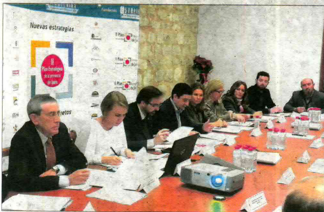
TRABAJO. Reunión del patronato de la Fundación Estrategias.

de este incendio, de los enseres y materiales de que disponía esta concejalía, así como de las inversiones que había realizado y que ardió". En cuanto a las investigaciones por parte de la Policía Científica de la Comisaría, avanza, según él, "a buen ritmo" y apuntan a una "intencionalidad" de este incendio. No en vano, como precisó ya anunció el alcalde, Javier Márquez, se encontraron acelerantes que fueron decisivos para causar el mayor daño posible en el antiguo cuartel.