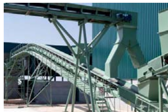
Los fosos de descarga, las cintas transportadoras, los túneles de lavado, los procesos de clasificación crean un complejo muy bien estructurado desde el punto de vista de la ingeniería industrial.

Esta planta recupera los residuos sólidos que se puedan reciclar, tales como plásticos, metales, vidrio y papel, produciendo al mismo tiempo compost para abono agrícola.