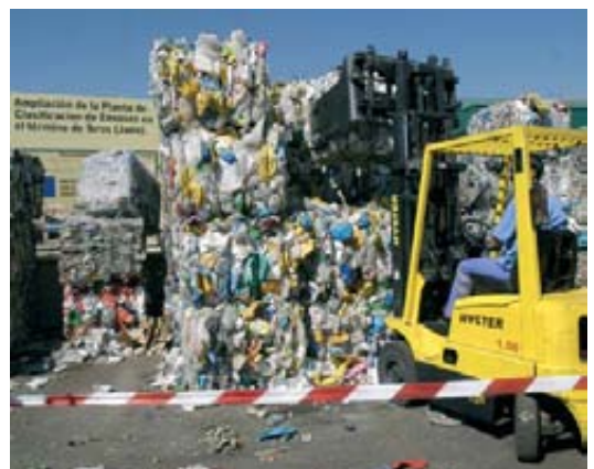
Imagen de la planta de residuos sólidos de Ibros.

Jefe de Servicio de Prevención y Calidad Ambiental de la Delegación Provincial de la Consejería de Medio Ambiente