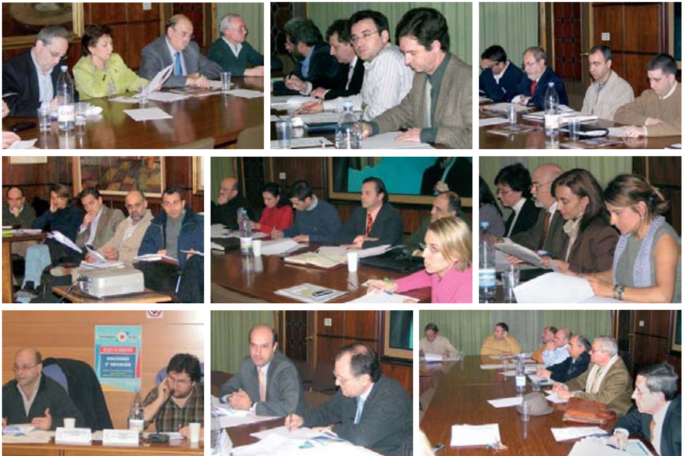
Las sesiones de los “grupos de impulsión” han seguido desarrollándose con una destacable actividad para poder elevar sus respectivos informes.

“La calidad del liderazgo de un directivo se aprecia en la actitud y el comportamiento de sus colaboradores” (J. C. Cubeiro)