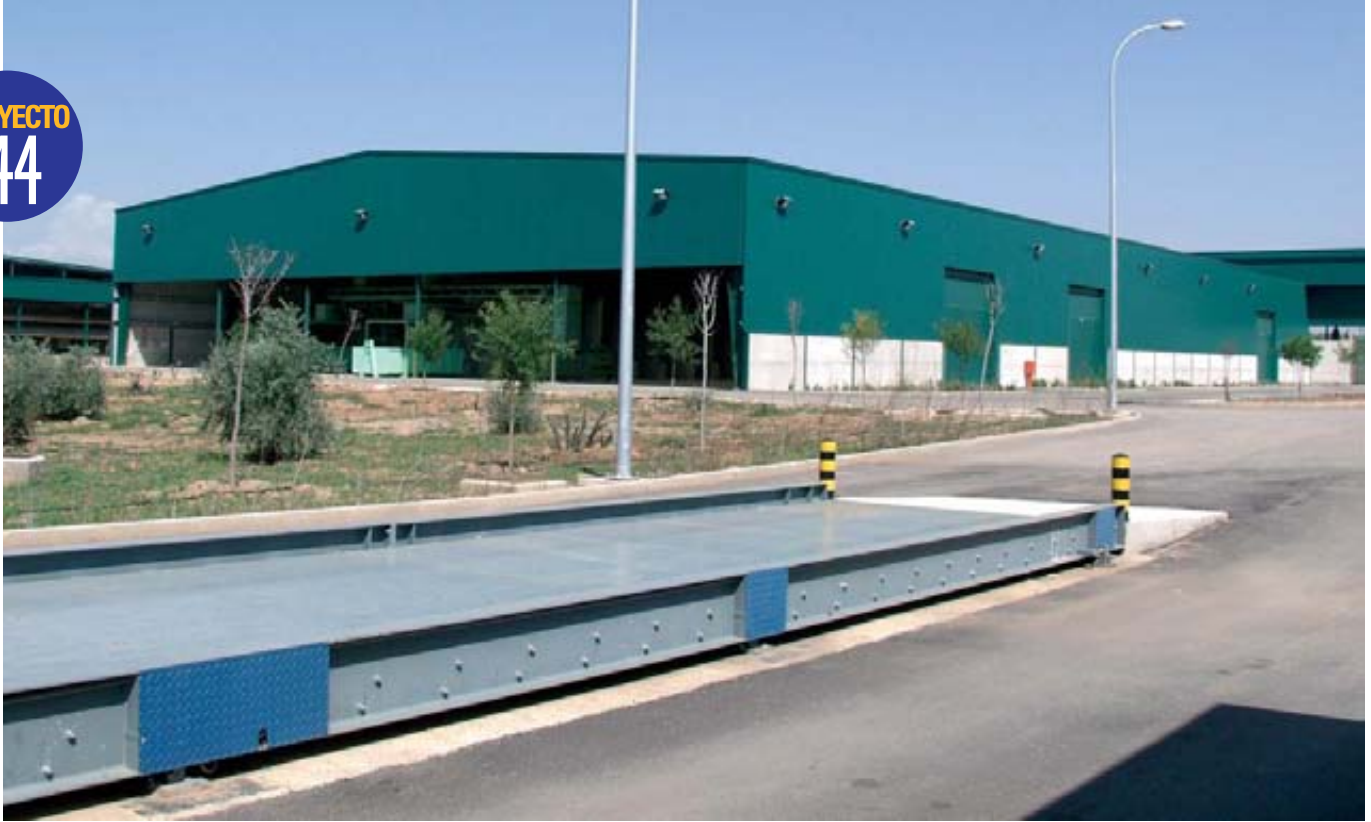
Planta provincial de Recuperación y Compostaje de Residuos Sólidos “El Guadiel”, en Linares