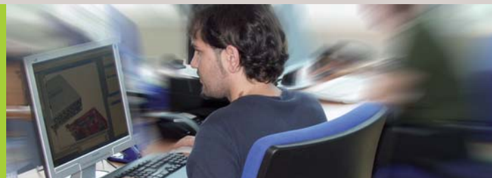
PARTICIPACIÓN CIUDADANA: COLABORAR SERÁ MÁS FÁCIL (pág. 5)