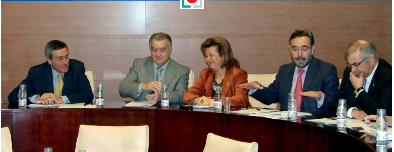
Reunión de los miembros del Patronato en el Centro de Convenciones de IFEJA, el 24 de febrero de 2009