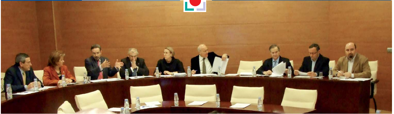
Reunión de los miembros del Patronato en el Centro de Convenciones de IFEJA, el 24 de febrero de 2009