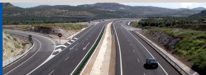
EVALUACIÓN: JAÉN, A LA CABEZA EN INVERSIÓN PÚBLICA (pág. 7)