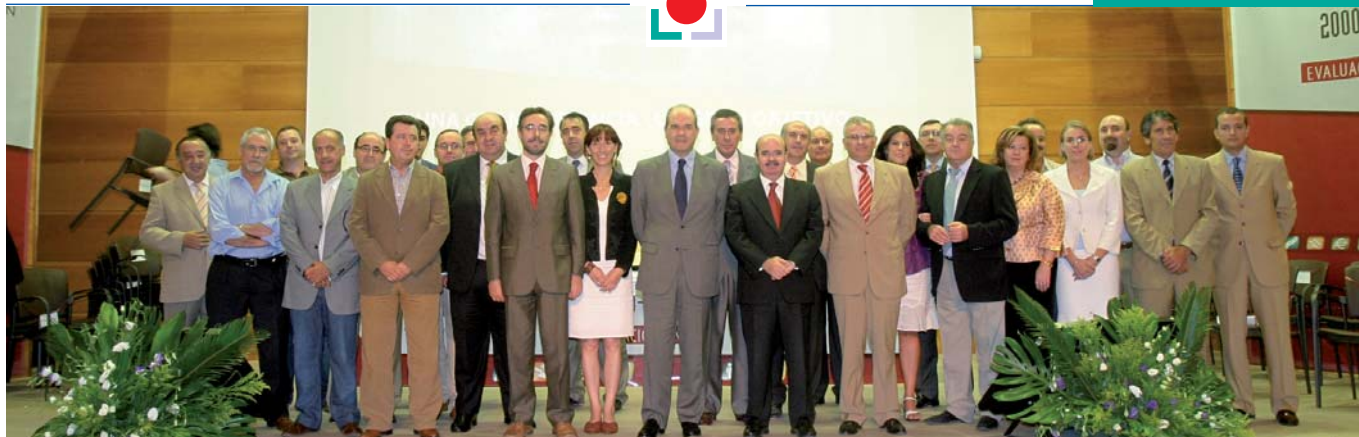
Foto de familia en el acto de presentación del libro de la Evaluación final del Plan Estratégico de la provincia de Jaén 2000-2007

La evaluación final del I Plan Estratégico se presentó el 17 de julio de 2008