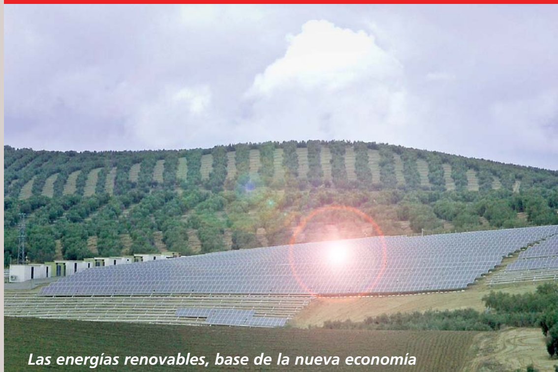
Las energías renovables, base de la nueva economía