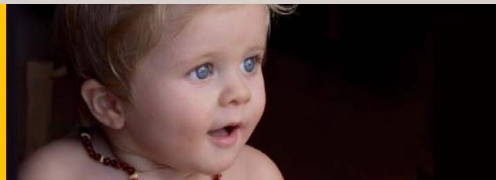
ACTUALIDAD: NACE UN SEGUNDO PLAN ESTRATÉGICO (págs. 2 a 5)

Son muchas las razones, como también son muchos aún los objetivos a alcanzar para mejorar el actual modelo productivo de provincia con una sociedad más dinámica. Lo que era una razón para hacer un segundo plan, es ahora más que nunca –en el contexto de una coyuntura global difícil– una razón radicalmente esencial para buscar nuevas estrategias, para nuevos retos .