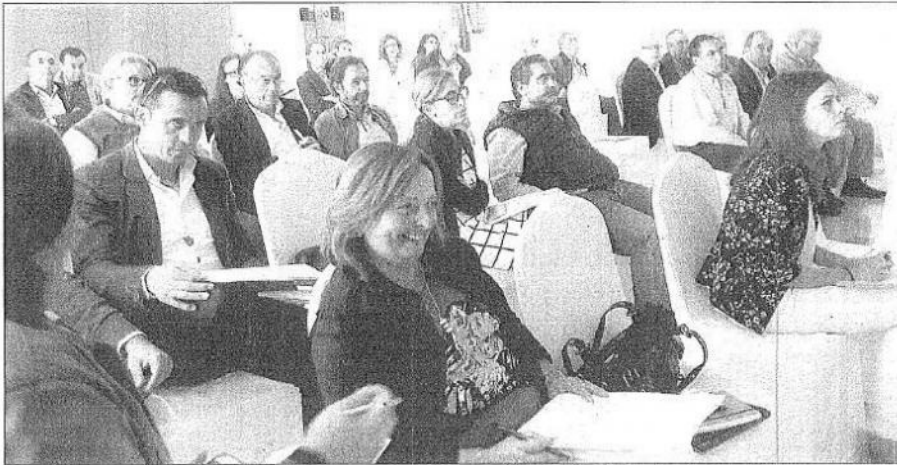
DEBATE. Representantes de las aceiteras jiennenses durante la asamblea de la Asociación Provincial de Almazaras.

La Federación Española de Fabricantes de Aceite de Oliva (Infaoliva) de Jaén valora que Isabel García Tejerina continúe como ministra de Agricultura. "Se trata de una mujer dialogante, comprometida y bastante pragmática. Siempre que hemos acudido, se ha mostrado muy cercana a los fabricantes de aceite", manifiesta Infaoliva.