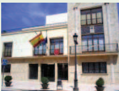
Ayuntamiento de Arroyo del Ojanco