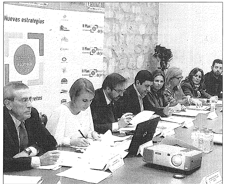
DISEÑO. Una de las reuniones del patronato de la Fundación.

En la jornada se reconocerá, también, la labor desarrollada por quienes impulsaron su creación e hicieron posible que en la provincia de Jaén exista un foro de este tipo.