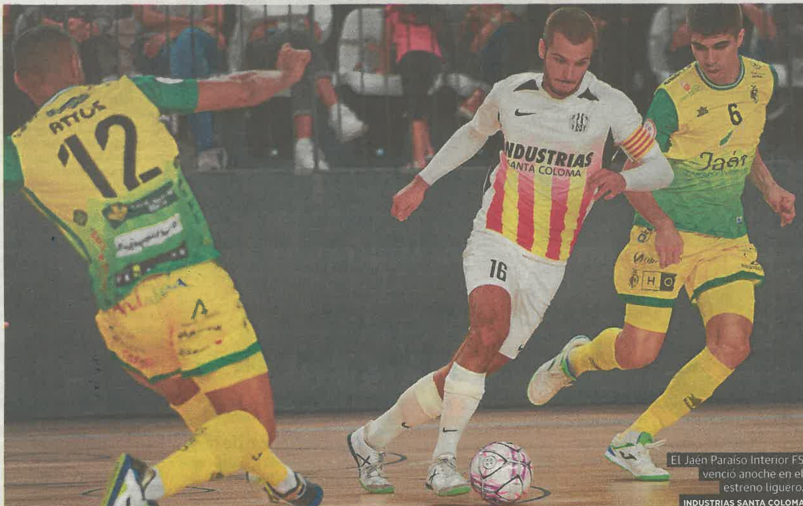
El Jaén Paraíso Interior FS venció anoche en el estreno liguero. INDUSTRIAS SANTA COLOMA

JAÉN INICIA HOY DIEZ DÍAS DE FIESTAS DE SAN LUCAS CON CASETAS, ATRACCIONES Y ACTIVIDADES SUPLEMENTO