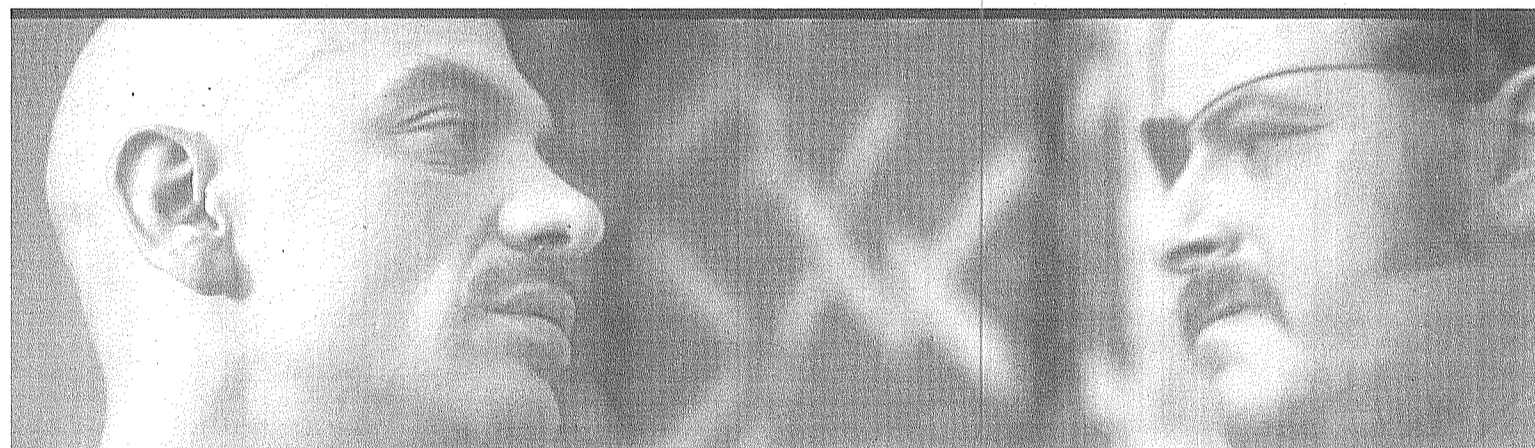
Detalle de un fotograma del cortometraje.

marco del ciclo de Sala, la obra 'La puerta de al lado', de la compañía Producciones Barco Pirata. Protagonizada por los populares y televisivos Silvia Marsó y Pablo Chiapella, cuenta la historia de dos vecinos que se detestan cordialmente -Chiapella se mueve como pez en el agua dada su amplia experiencia en 'La que se avecina'-. Dos solteros en plena crisis de los 40 que, como miles de urbanitas perdidos, se sumergen en Internet, donde intentan encontrar su media naranja.