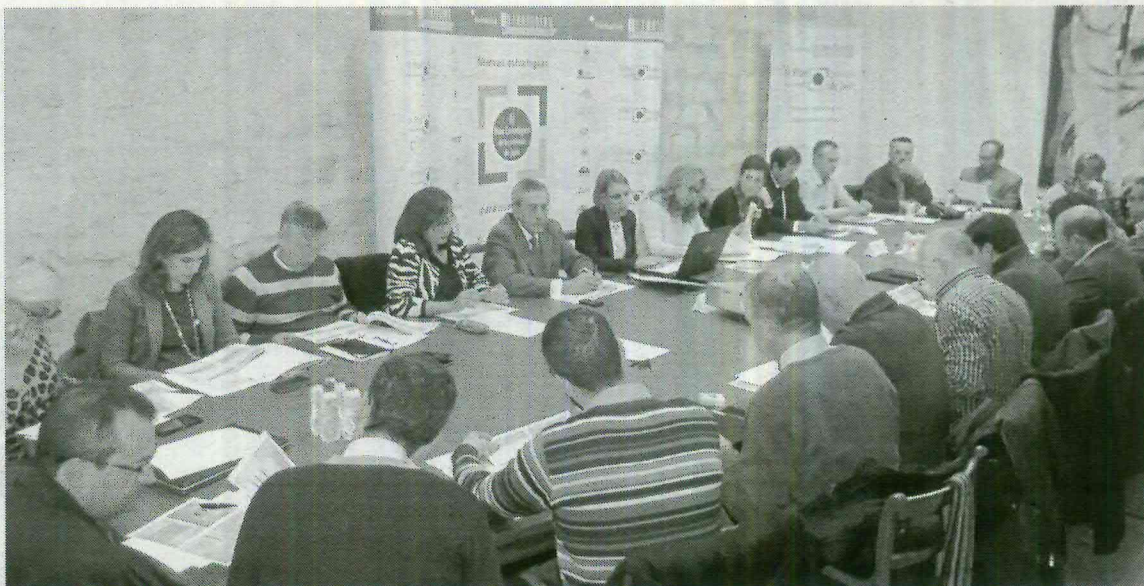
Reunión de trabajo de la Estrategia 'Jaén paraíso interior', del Plan Estratégico de la provincia. :: IDEAL

Por otro lado, los trabajadores sociales desarrollarán diversas iniciativas en centros de personas con discapacidad y el geógrafo trabajará con el Ministerio de Medio Ambiente saharauí en proyectos innovadores. Además la asociación firmará un proyecto de hermanamiento con los territorios liberados del Sáhara Occidental, una zona desértica controlada por el gobierno saharauí que emerge acción social y solidaria.