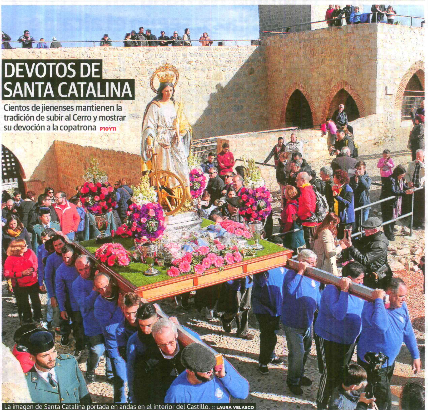
La imagen de Santa Catalina portada en andas en el interior del Castillo.

Un sector del PP teme un retroceso frente a la corrupción mientras C's se niega a revisar el pacto P28