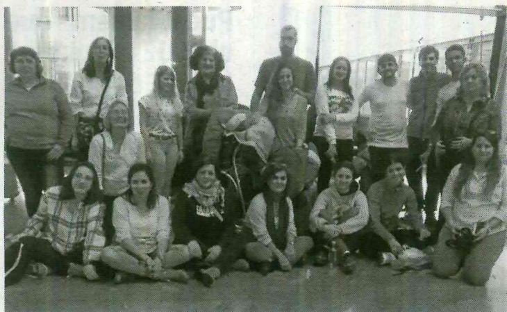
Miembros de la expedición a los campamentos saharauis.